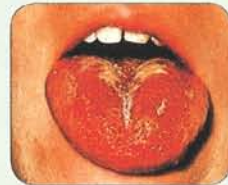
แผ่นฝ้าที่ลิ้น