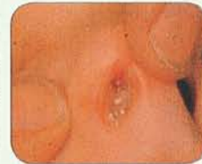
แผ่นฝ้าในจมูก